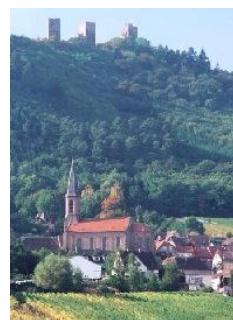
Commune de Husseren-les-Châteaux 68420

toutes les bonnes volontés pour venir, avec nous, réfléchir et élaborer les stratégies interdisciplinaires du développement en cohérence avec nos voisins proches. L'APR est le Think tank des penseurs et décideurs alsaciens; il lui incombe donc d'identifier les synergies latentes, de les favoriser, et de les mettre en place pour que l'Alsace en 2030 soit une région ultra performante sur tous les plans.